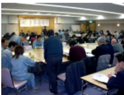
問題点抽出の様子