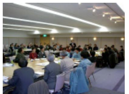
問題点発表の様子