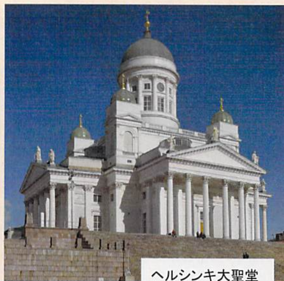
ヘルシンキ大聖堂