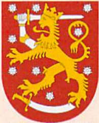
フィンランド国章