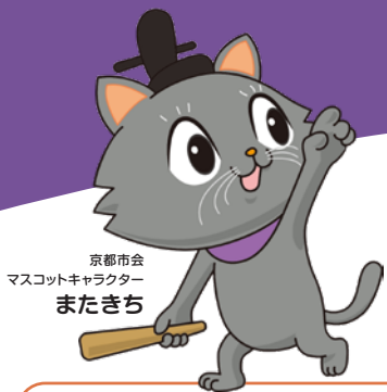
京都市会 マスコットキャラクター またきち