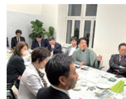
オーストリア バイオマス協会での ディスカッション

今回は、「2040年までのカーボンニュートラル」という国家目標を掲げている環境先進国オーストリアを調査しました。調査で得られた成果等については、今後報告会や市会ホームページなどでお伝えしていきます。