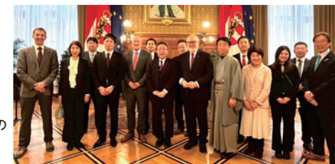
ウィーン市議会への 訪問