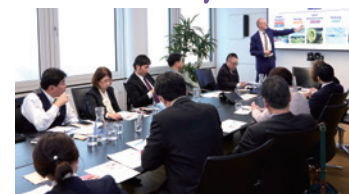
ウィーン市営企業でのレクチャー