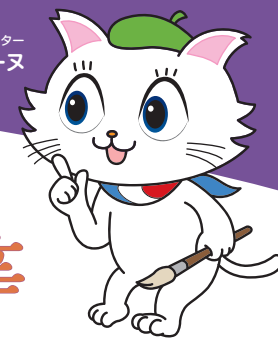
京都市会マスコットキャラクター マトリーヌ