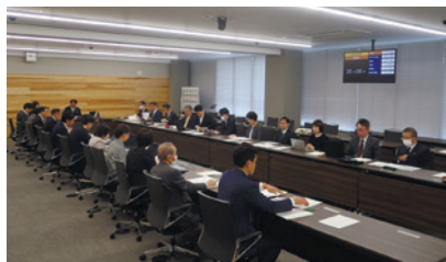
京都基本構想審査特別委員会総括質疑の様子