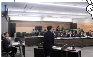
決算特別委員会 総括質疑

総括質疑では、分科会の議論を踏まえたうえで、市長や副市長らに対して一問一答で質疑を行ったよ！