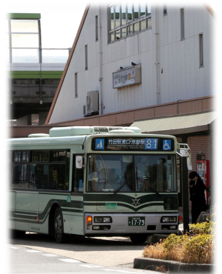
鉄道駅への接続など系統の新設・運行ダイヤの充実 (竹田駅東口)