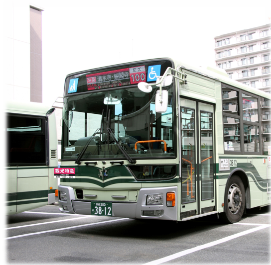
「観光特急バス」の新設など観光系統の再編 (※画像はイメージです)

東山エリアの観光に便利な一般バスと別運賃の「観光特急バス」を新設するほか、市内観光に便利な観光系統を設定し、日常生活を中心とした市民利用と観光利用の棲み分けを図ります。