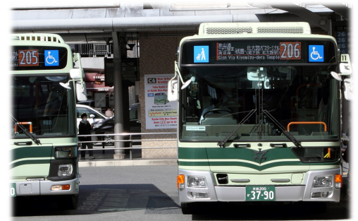
市内中心部の循環系統・幹線系統の増便 (京都駅前Dのりば)

パターンダイヤの導入や系統間のダイヤ調整など、分かりやすく利便性の高いダイヤ編成を進めます。