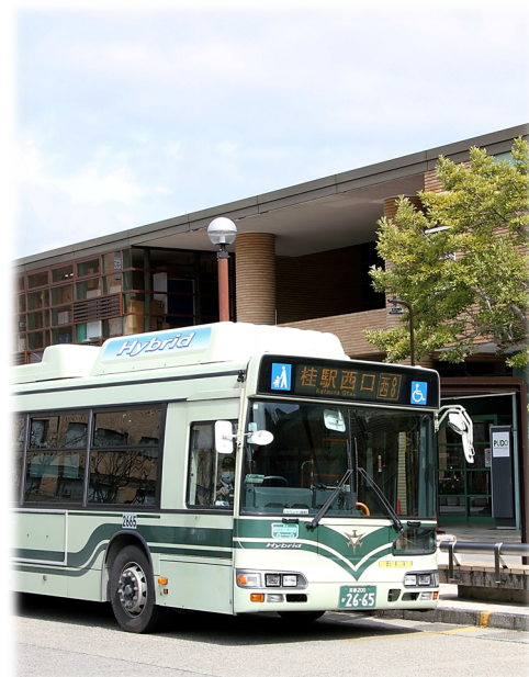
洛西地域のまちづくりと連携した運行の見直し (洛西バスターミナル)