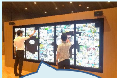
さまざまな分野の画像が動いています。何気なく触れた画像からいろんな発見をしていただけます。