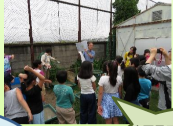
企画展示室での展示のほか、自然観察会ではフィールドで生物多様性の大切さを学びます。