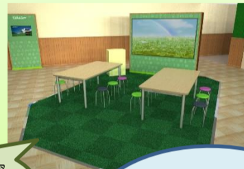
展望台では実際に見えているものをARを用いて解説。また、昔(近世)の横大路沼・巨椋池を再現した風景イメージを360度VRで再現。