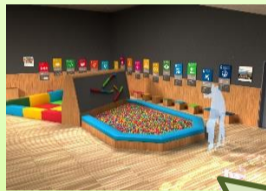
SDGsを紹介するコーナーにはSDGsアイコン色のボールプールを設置。