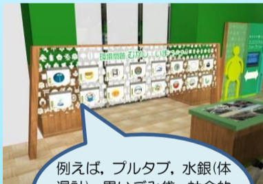
例えば、ブルタブ、水銀(体温計)、黒いごみ袋、社会的に解決してきた課題を紹介します。