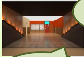
ホンモノの運転台でクレーン模型を稼働