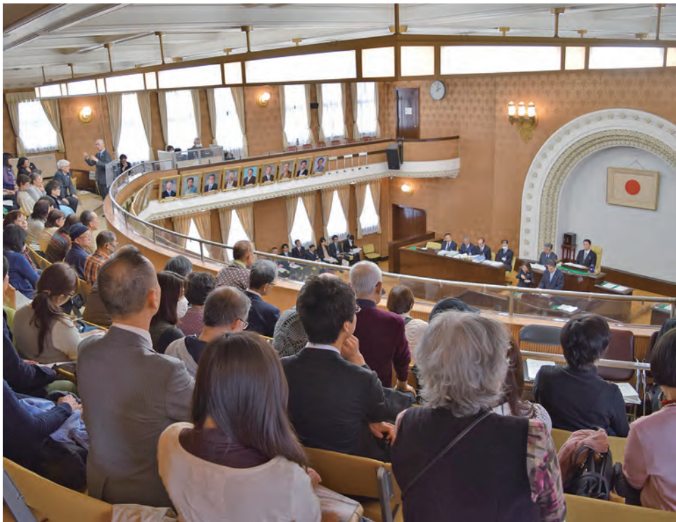
傍聴席の様子 (平成28年 3月撮影)