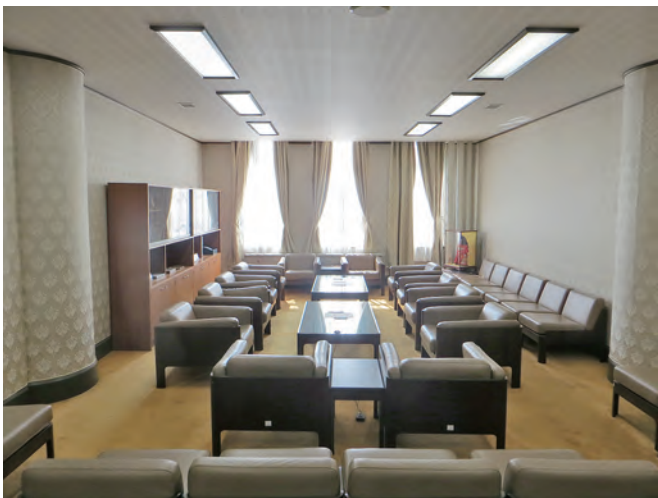
市会運営委員会理事会室