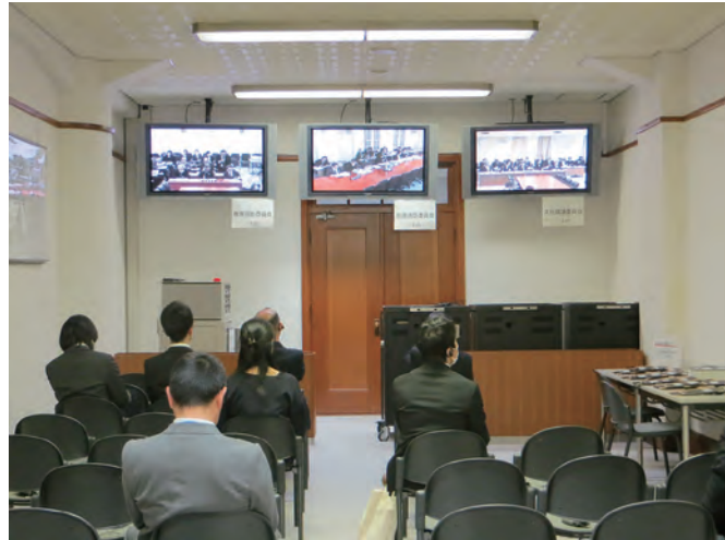
市会モニター視聴室