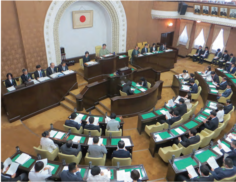
本会議の様子 (平成30年 5月撮影)