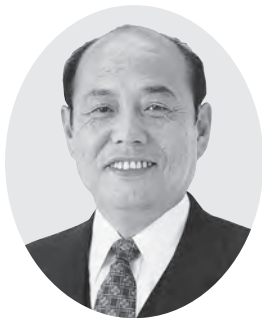
第69代 二之湯 智