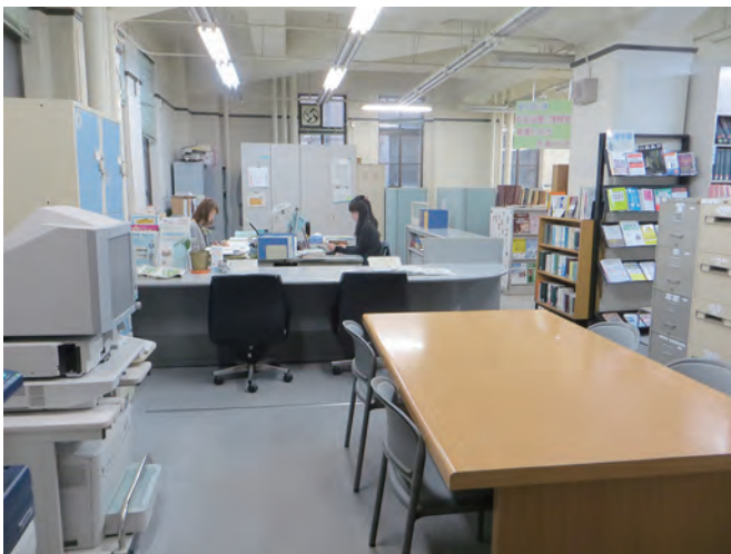
市会図書・情報室 1