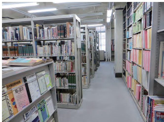
市会図書・情報室 2