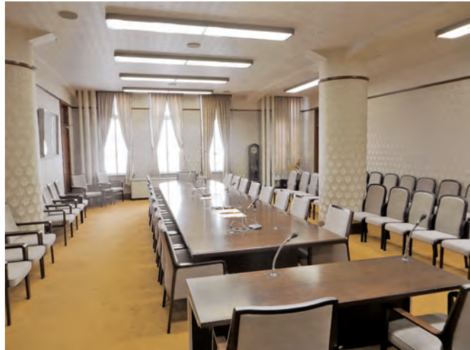
市会運営委員会室