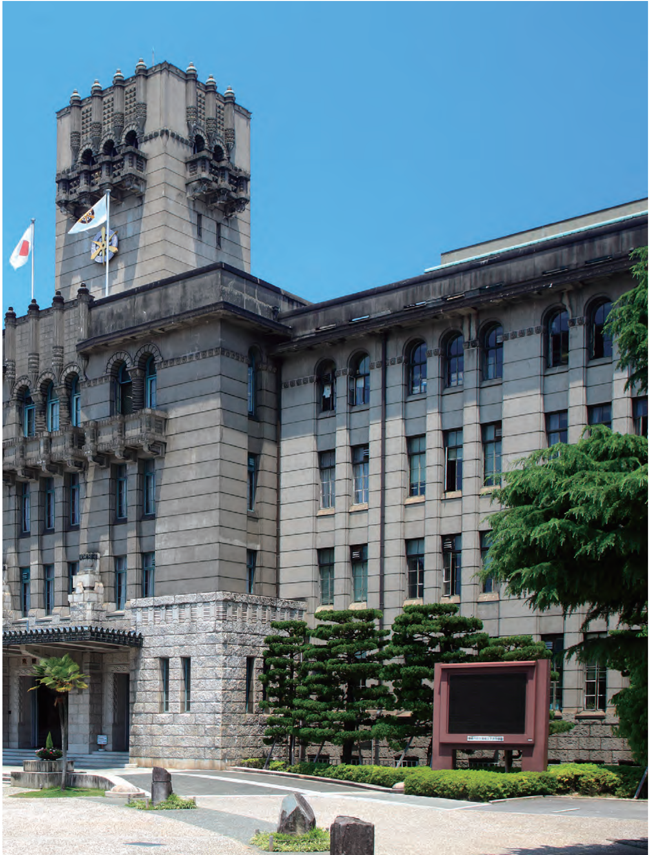
議会棟は京都市役所の2階（平成22年6月撮影）