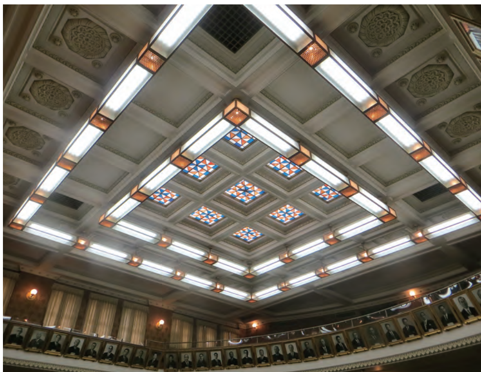
漆喰とステンドグラスを組み合わせた天井の意匠 (外輪照明は昭和56年に増設)