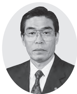
第68代 可見 達志