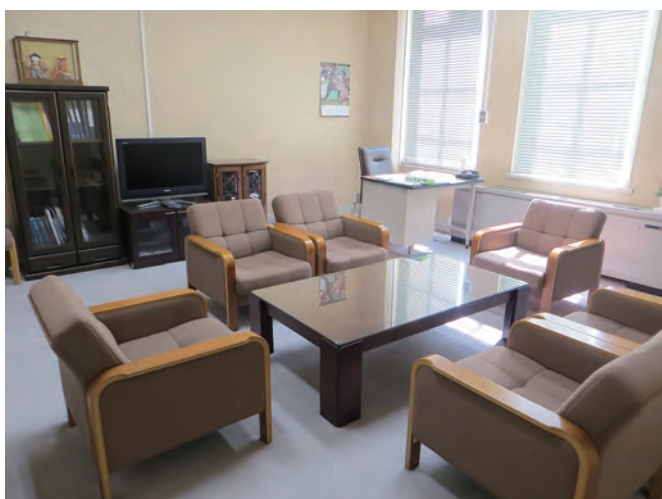
市会運営委員長室