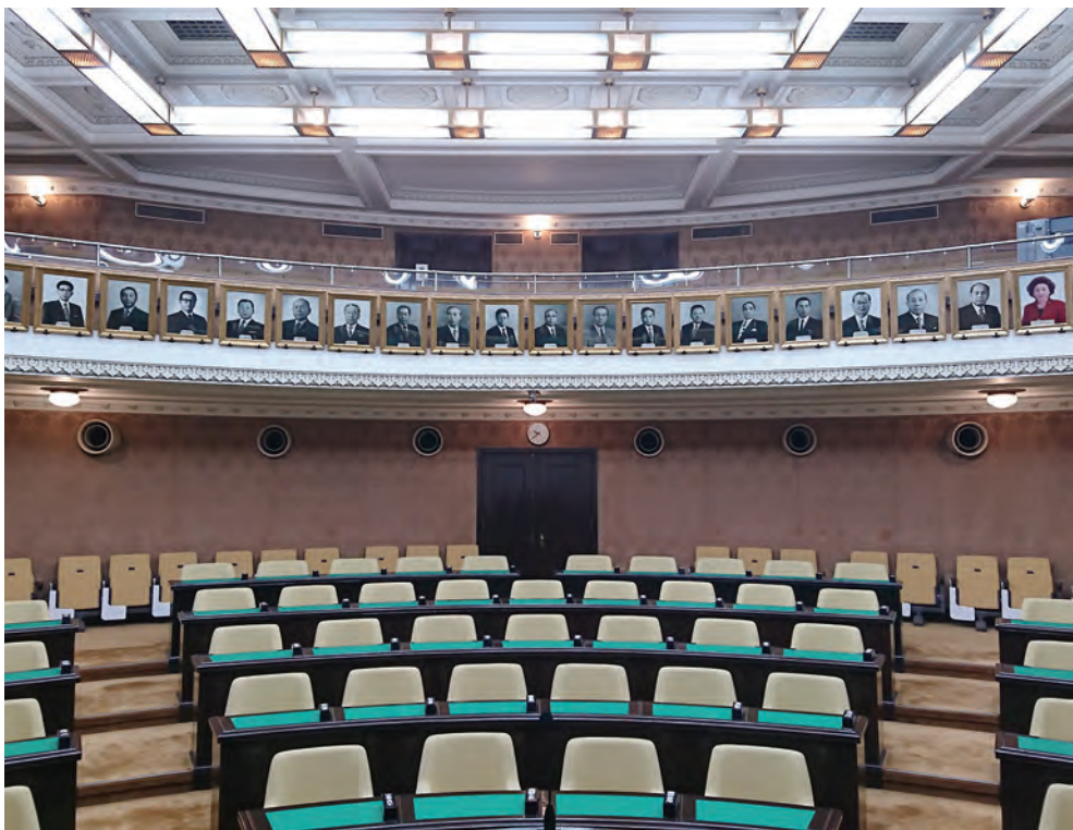
議長席から見た議場 (人物写真は歴代議長)