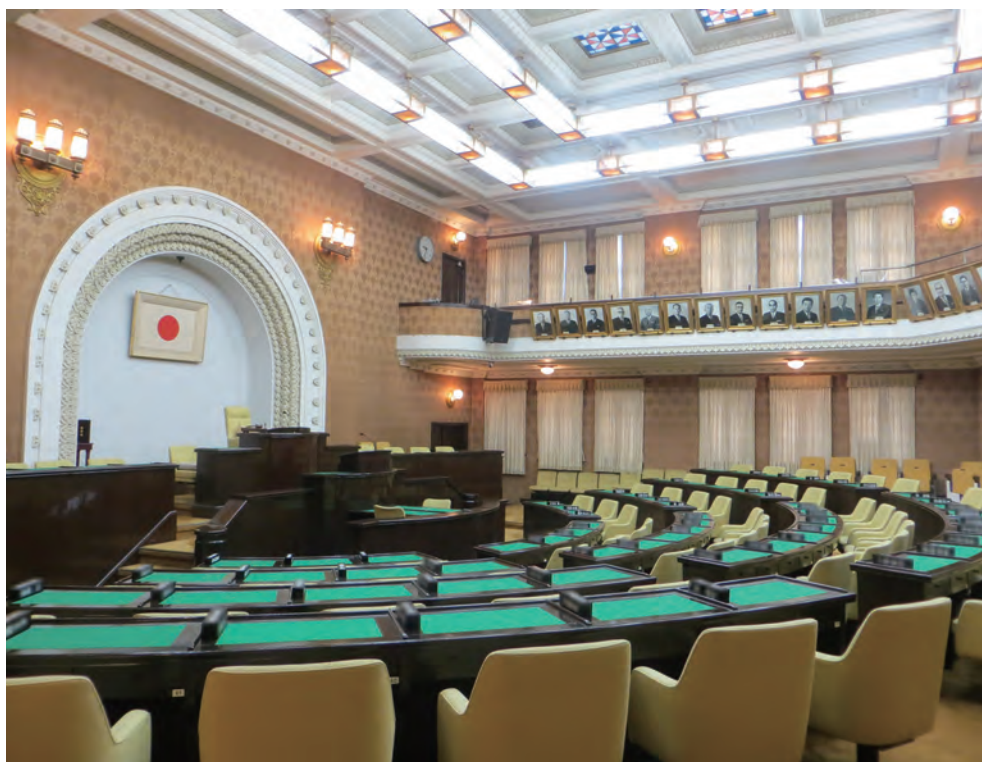
半円形の座席配置