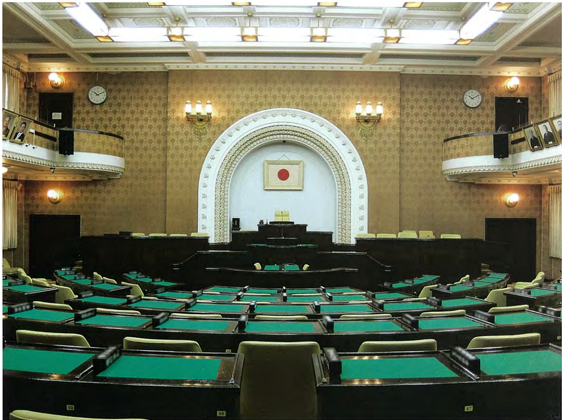
(平成27年 6 月撮影)