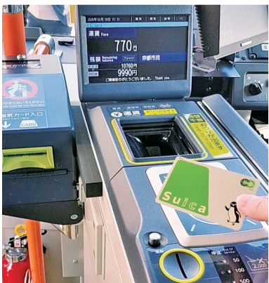
※表示されている運賃は、実証実験用の仮の金額です。

A 全地域を対象とし、均一区間は令和9年度中に、調整区間も同時期の実施を目指す。改定後の運賃は350円から400円、市民運賃は200円としたい。市外在住で一定頻度の利用がある方への負担軽減策も検討。バス・バス無料乗継は更に検討を深める。本市施設の市民優先価格は、施設特性等を踏まえ検討を加速させる。