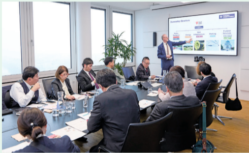
ウィーン市営企業でのレクチャー