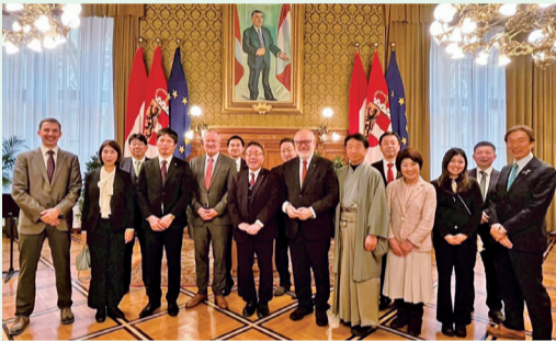
ウィーン市議会への訪問