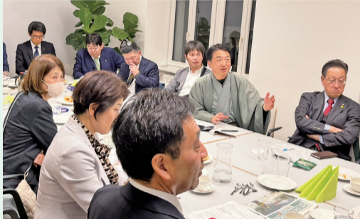
オーストリアバイオマス協会でのディスカッション

今回は、「2040年までのカーボンニュートラル」という国家目標を掲げている環境先進国オーストリアにおいて、脱炭素社会の実現に向け着実に進む再生可能エネルギーへの転換や先進的な熱利用の取組、持続可能な公共交通の取組などを調査しました。調査で得られた成果等については、今後報告会や市会ホームページなどでお伝えしていきます。