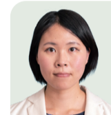
森 かれん 議員 (上京区)