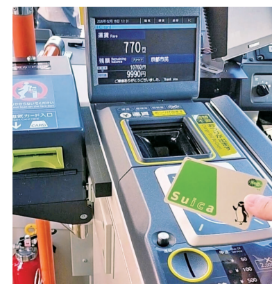
※表示されている運賃は、実証実験用の仮の金額です。

全地域を対象とし、均一区間は令和9年度中に、調整区間も同時期の実施を目指す。改定後の運賃は350円から400円、市民運賃は200円としたい。市外在住で一定頻度の利用がある方への負担軽減策も検討。バス・バス無料乗継は更に検討を深める。本市施設の市民優先価格は、施設特性等を踏まえ検討を加速させる。