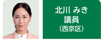
北川 みき 議員 (西京区)

公共交通事業者に対する支援とともに将来にわたり採算性が見込める持続可能な運行形態の検討や地域の実情に応じた地域主体の取組への支援を行っている。他都市事例も研究しながら、今後も最適な手法を検討し、市民の移動手段の確保を支援していく。