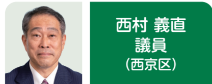
西村 義直 議員 (西京区)