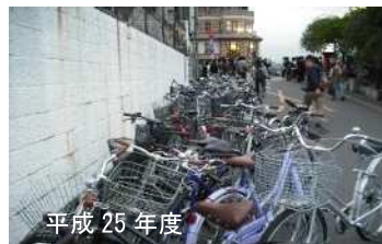
平成 25 年度

令和 3 年 3 月末現在、市内では 267 箇所の駐輪場が運営されており、また、商業施設等の規模にも応じて、駐輪場の設置を義務付けることにより、駐輪環境は大幅に改善しました。また、放置自転車の防止啓発や撤去に取り組んできた結果、令和 2 年度の 1 日当たりの放置自転車台数は、ピーク時（昭和 60 年度）の 200 分の 1 以下に減少しています。