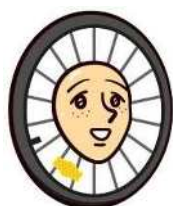
自転車のチャーリー

※3 京都府が定めている自転車事故件数の目標値(令和7年750件←令和元年1,121件)を基に設定した。