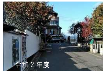
令和 2 年度