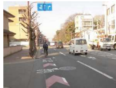
図 矢羽根マークによる整備

歩行者の安全を第一とし、自転車利用者が車道の左側を走行しやすいよう、整備手法を定めた「京都市自転車走行環境整備ガイドライン」を策定し、矢羽根マークを主とした自転車走行環境の整備を進めています（令和 3 年 3 月末で 180.0km）。