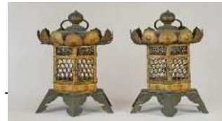
金銅亀甲文透六角釣灯籠