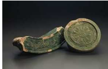
豊楽殿跡出土緑釉瓦

今後25年間の市政運営の理念を掲げた 「 京都基本構想 」策定（令和7年12月）