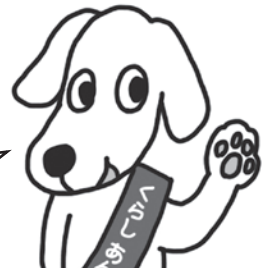
くらしあんしんクン

みんなでやる活動だけが防犯じゃない！ あなたの暮らしをちょっと変えるだけでも防犯になるよ！