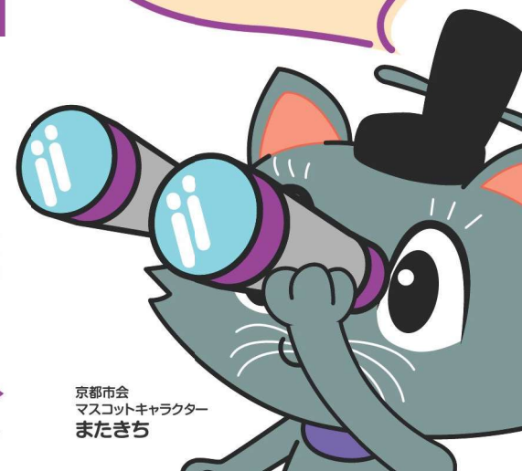
京都市会 マスコットキャラクター またきち