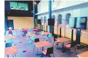
市会オープンスペース

新設移転 北庁舎3階 市会オープンスペース(市会モニター視聴室) モニターやテーブルセット、授乳室を設置したオープンスペースを新設し、市会議場傍聴入口・市会モニター視聴室を市会オープンスペース内に移転しました。市民の皆様もぜひ、ご利用ください!