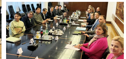
▲ザグレブ市長及び同市議会議員等との意見交換