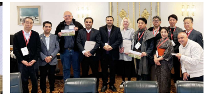
▲リュブリャナ市議会議員等との意見交換