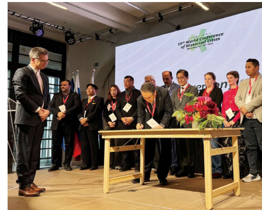
▲「リュブリャナ宣言」への署名

そのほか、姉妹都市ザグレブ市(クロアチア共和国)にある、在クロアチア日本国大使館やザグレブ市役所を表敬訪問しました。市役所では、市長及び同市市議会議員等と意見交換を行い、今後両市間で一層交流を深めていくことを確認しました。