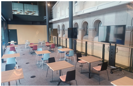
市会オープンスペース

市会オープンスペース(市会モニター視聴室)モニターやテーブルセット、授乳室を設置したオープンスペースを新設し、市会議場傍聴入口・市会モニター視聴室を市会オープンスペース内に移転しました。市民の皆様もぜひ、ご利用ください!