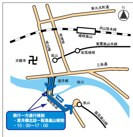
図1 令和2年11月21日(土)、22日(日)、23日(月・祝)、28日(土)、29日(日)の5日間における嵐山周辺交通規制図

(※) 長辻通では、年間を通じて土・日・祝日に北行一方通行規制【午前10時～午後5時、二輪除く】が実施されていますので御注意ください。