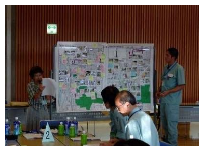
問題点発表の様子