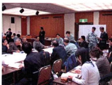
問題点抽出の様子