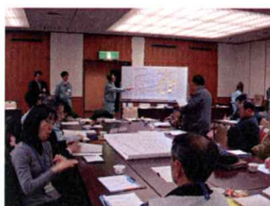
問題点発表の様子