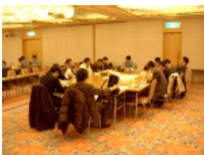
問題点抽出の様子