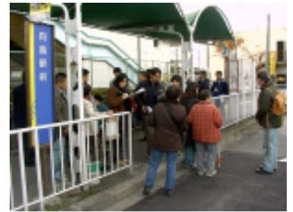
駅前広場調査風景