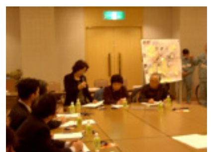
問題点発表の様子