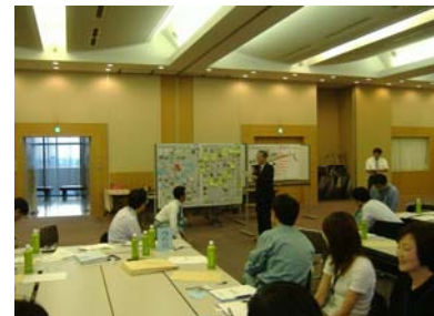
問題点発表の様子