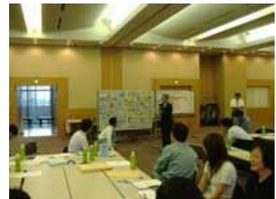
問題点発表の様子