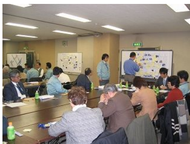
問題点抽出の様子