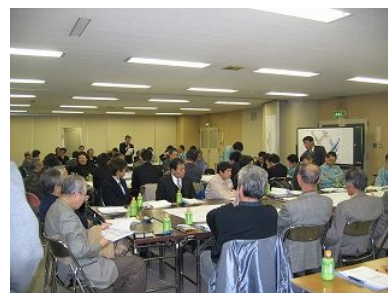
問題点発表の様子