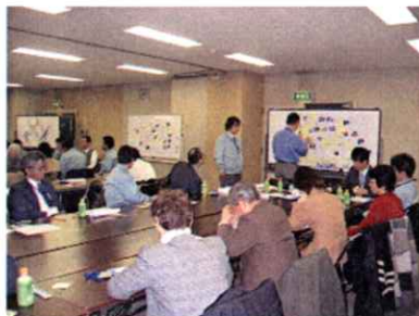
問題点抽出の様子