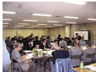
問題点発表の様子