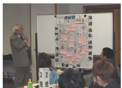
問題点発表の様子