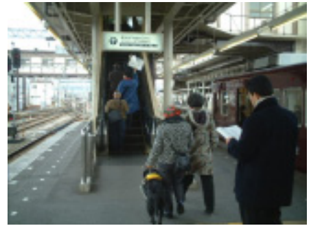
駅ホーム調査風景