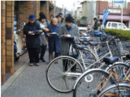
駅前広場調査風景