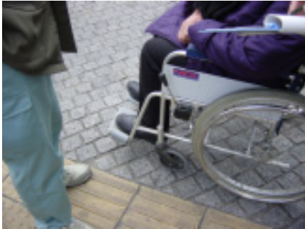
駅前広場調査風景