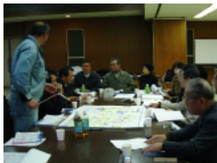
問題点抽出の様子