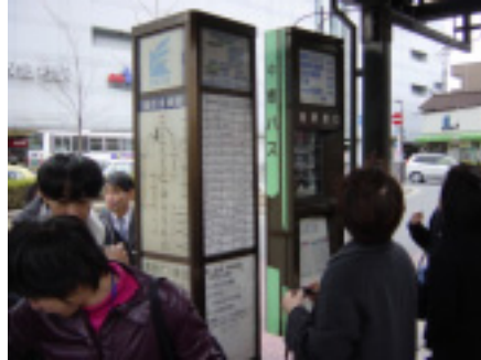
駅前広場調査風景