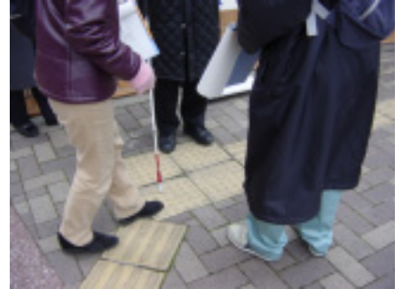
駅前広場調査風景