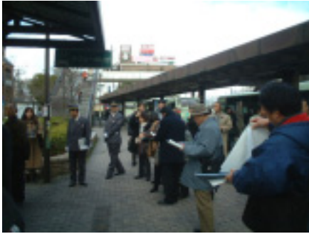
駅前広場調査風景