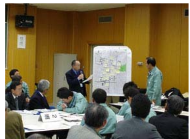
問題点発表の様子