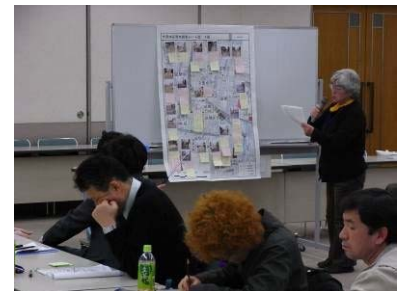
問題点発表の様子