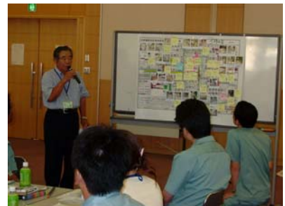
問題点発表の様子