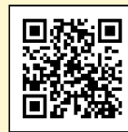
市会ホームページ