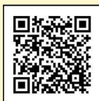
インターネット議会中継

本会議や委員会の生中継と録画の動画を配信しています。市会ホームページ、市会YouTubeから、ぜひご視聴ください。