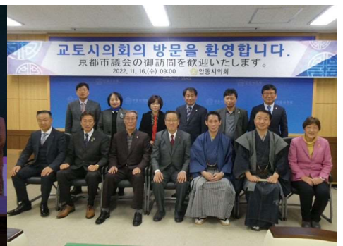
安東市議会との意見交換