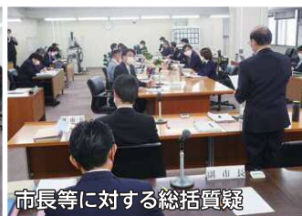
市長等に対する総括質疑