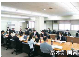
基本計画審査特別委員会

令和3年度から令和7年度までの5年間の市政全般にわたる総合計画について、基本計画審査特別委員会でしっかりと審議し、可決しました。