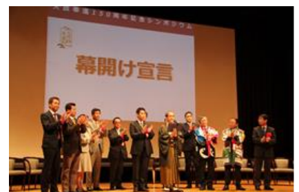
【幕開け宣言(29.1.22)の様子】