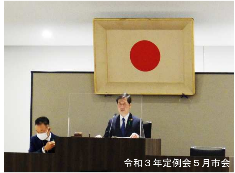
令和3年定例会 5月市会