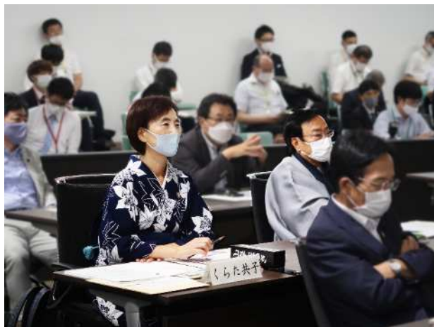
関西広域連合議会本会議（令和3年8月26日京都市会議場にて）