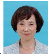
くらた 共子 共 産 ⑤