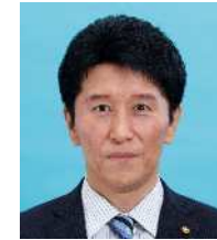
しまもと京司 自民 ③