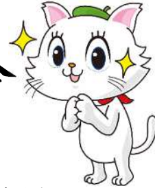
京都市会マスコットキャラクター マタリーヌ