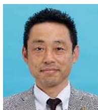
樋口 英明 共 産 ⑤