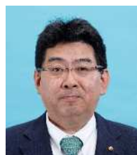
みちはた弘之 自民 ②