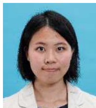
森 かれん 京 都 ②