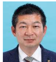
田中たかのり 自民 ②