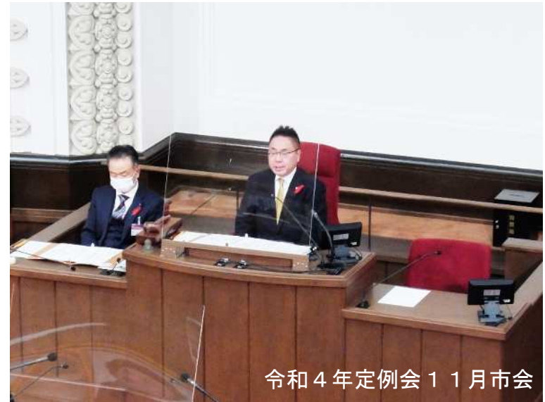
令和4年定例会 11月市会