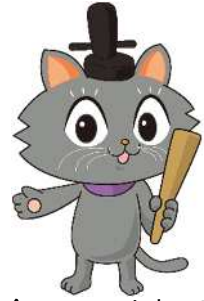
京都市会マスコットキャラクター またきち