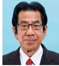
富 きくお 自民 ⑩