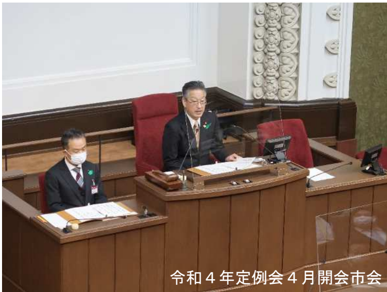
令和4年定例会 4月開会市会