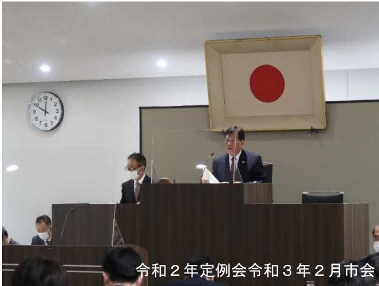
令和2年定例会 令和3年2月市会