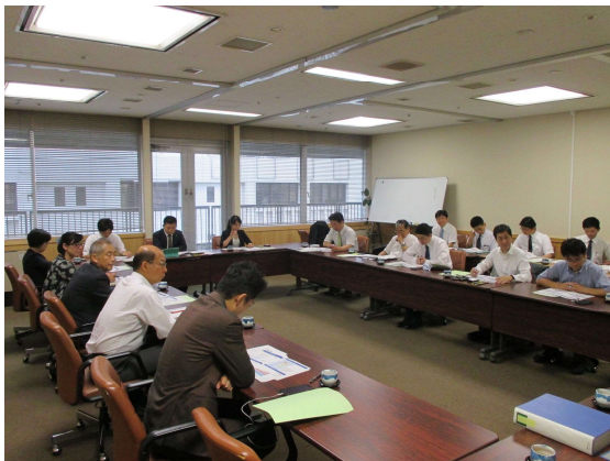
福岡市役所会議室