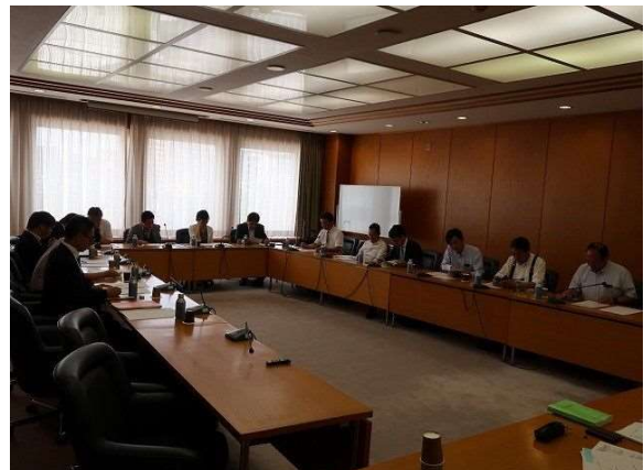
さいたま市議会会議室