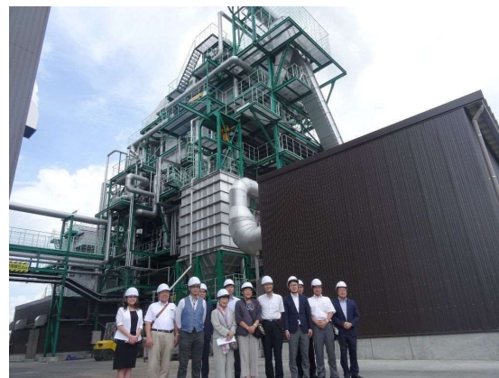
SGETグリーン発電三条