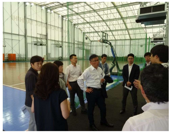
アリーナ立川立飛