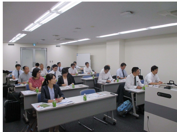
西日本鉄道株式会社