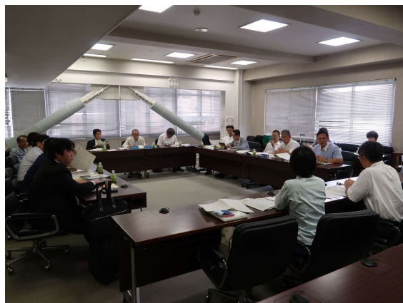
川崎市役所会議室