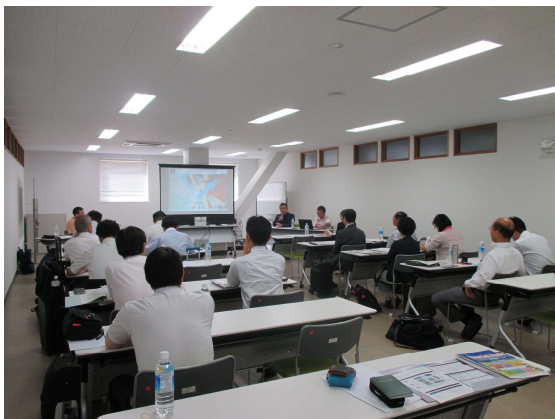
沖縄ITイノベーション戦略センター