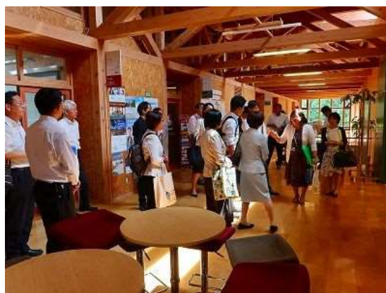
公立大学法人国際教養大学