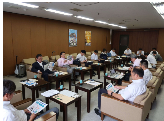
札幌市役所会議室