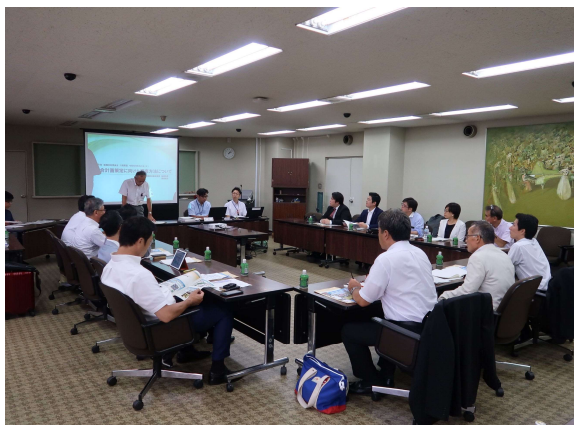
小田原市役所会議室