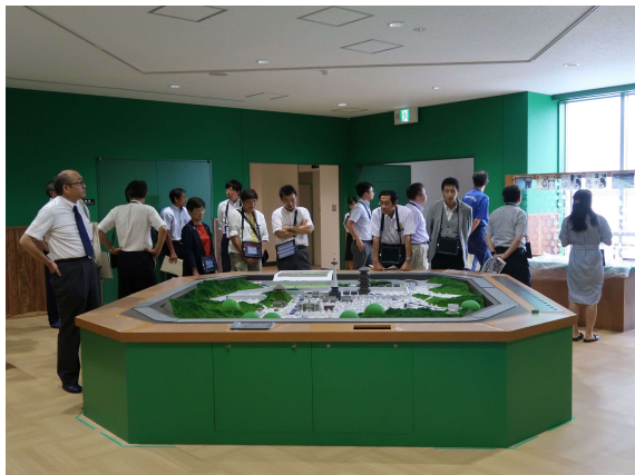
南部クリーンセンター第二工場