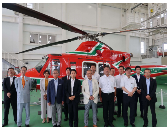
仙台市消防航空隊庁舎