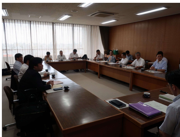
世田谷区役所会議室