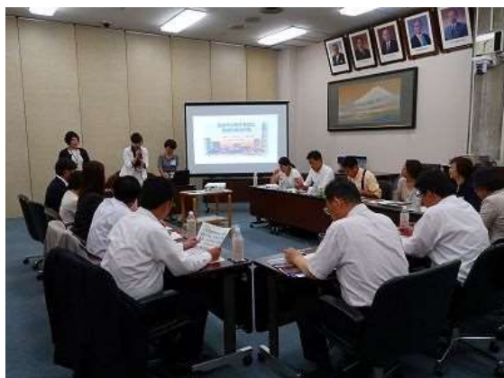
横浜市役所会議室