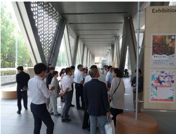
東京都現代美術館