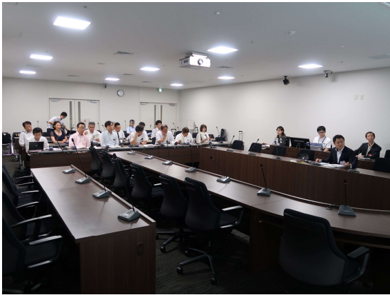
豊島区役所会議室