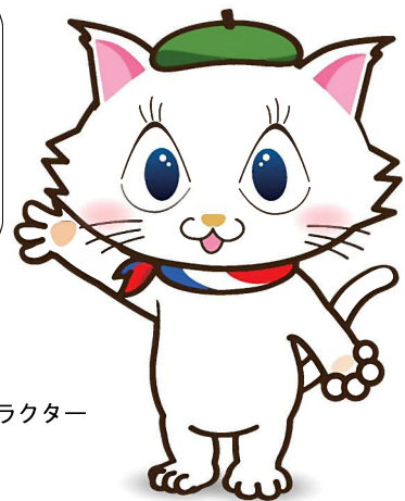
京都市会マスコットキャラクター マタリーヌ

上記の情報なども参考に、京都市会のことをよ～く知って、デザインを考えてくれたら嬉しいな！