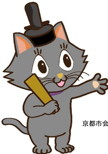
京都市会マスコットキャラクター またきち

上記の情報なども参考に、京都市会のことをよ～く知って、デザインを考えてくれたら嬉しいな！