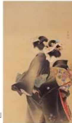
上村松園 「人生の花」