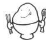
こごみちゃん パプロメくん