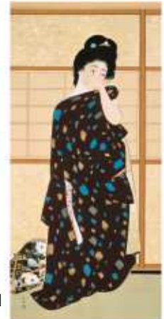
竹内栖鳳 「絵になる最初」