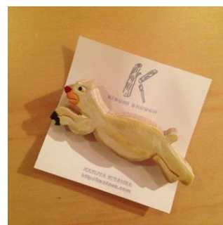
ブローチ (イメージ)

板状の木材を加工してブローチを制作します。自由にデザインしたものを木材に描き、彫刻刀で半立体に彫りおこします。(中学生以上対象)